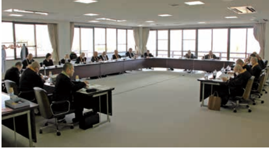
◎「一隅を照らす運動」理事会を開催