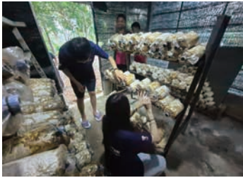
キノコの収穫 (朝課体験)