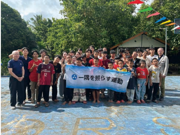
「生き直しの学校」 チュンポーン校での集合写真

十八年度より開催されており、本年で六回目を迎える。高校生がアジアの貧困地域の現状に触れ、机上での学習だけでは得ることのできない経験を積むことで、「一隅を照らす」人材を育成することを目的に実施している。コロナ禍は開催中止を余儀なくされたが、令和六年度より再開された。一行は十一月十四日深夜に日本を出発し、同日早朝、タイに到着した。その後、バンコクにあるドウアン・プラティープ財団を訪問した。