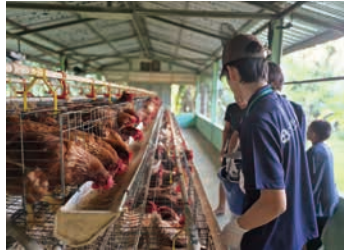
鶏卵採集と餌やり (朝課体験)