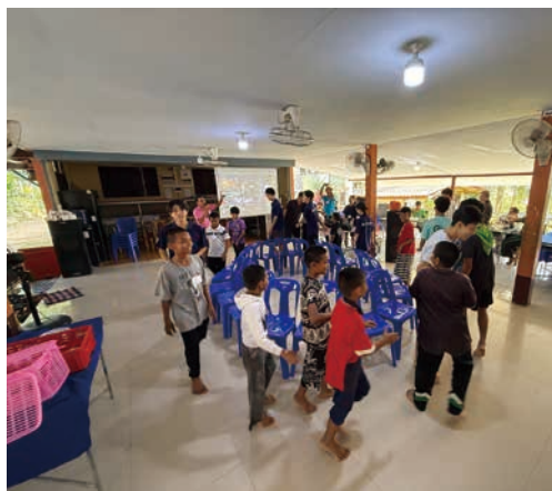
イス取りゲームで日本文化交流