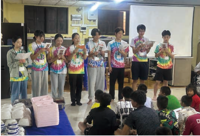
童謡「もみじ」の合唱披露