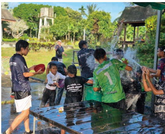
ソンクラーン（水かけ祭り）を体験