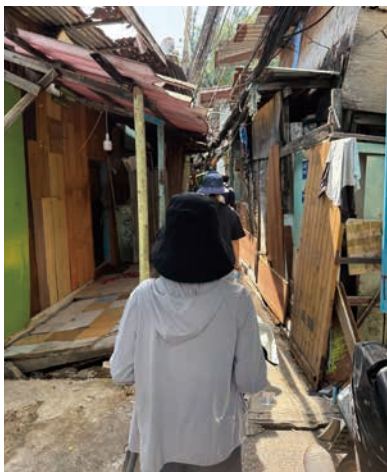
クロントイ・スラム現地視察

日本文化を学んでもらった。言語の壁がありながらも、互いに歩み寄り、関わり合おうとする姿が頻繁に見られた。 十六日の送別会では、別れに涙する姿が互いに見られた。 一隅を照らす運動総本部では、より多くの「一隅を照らす」人材を育成するため、宗内のみならず日本の青少年を対象に、今後もスタディーツアーを続けていく。