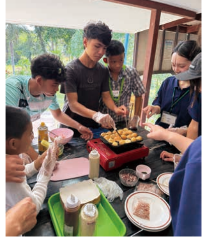
たこ焼き作りを伝授