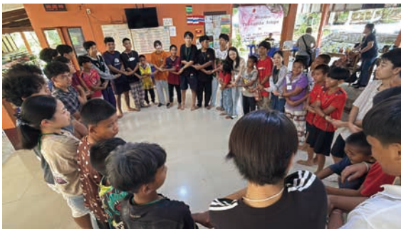
皆で手を繋ぎ、別れを惜しむ