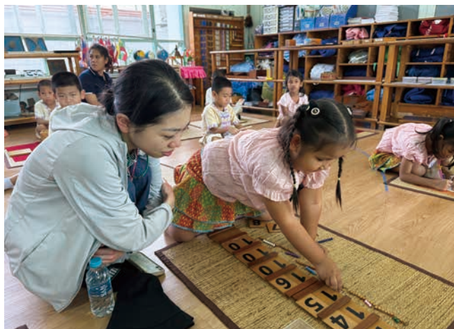
プラティープ幼稚園の園児と交流