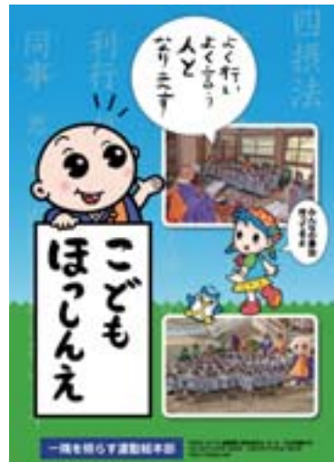
「こどもほっしんえ」のポスター

つきましては「こどもほっしんえ」ページ( http://ichigu.net/information/hosshine.html )よりダウンロードしていただき、ご活用いただきますようお願い申し上げます。